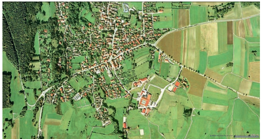
Die Vogelperspektive vermittelt einen umfassenden ersten Eindruck vom Urlaubsort

Einfache Kartenansichten von Ferienorten sind Schnee von gestern – die interaktiven Geoportale von hubermedia modernisieren die Tourismusbranche.